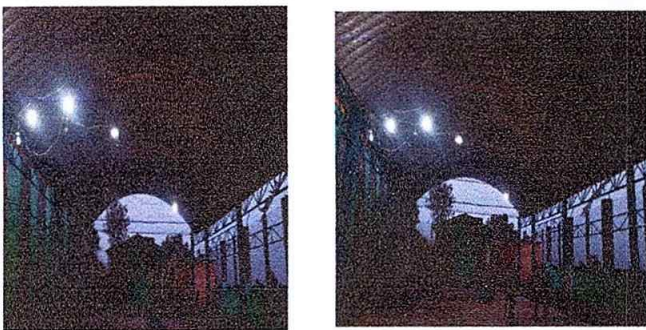
Foto 5: Modulo 2 Reparación de cableado y sustitución de lamparas.