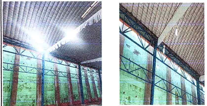
Foto 4: Modulo 2, Cancha Polideportiva. Sustitución de toma de corriente doble y sustitución de interruptores dobles