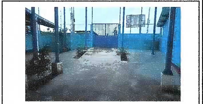
Modulo 4: Sustitucion de piso de torta de concreto, reparación de cuneta de concreto, reparación de banqueteta.