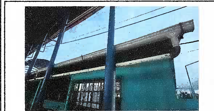
Modulo 3: Sustitución de canal de pvc, sustitucion de bajada de agua pluvial de metal por tuvo pvc 3".