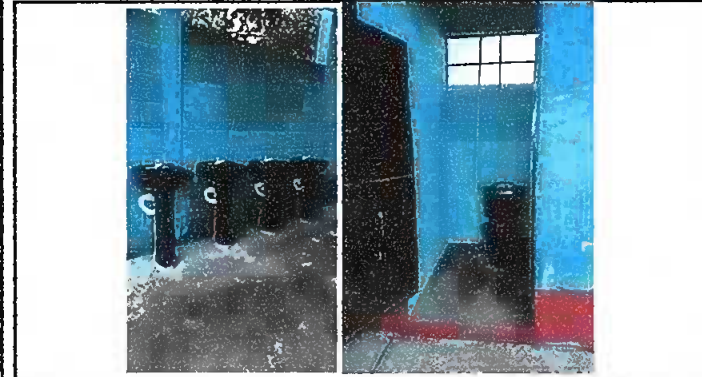
Modulo 1: Sustitucion de inidoro s,lavamanos, tuberia de linea principal, instalacion de tuberia de agua potable y sustitucion de deposito de agua.