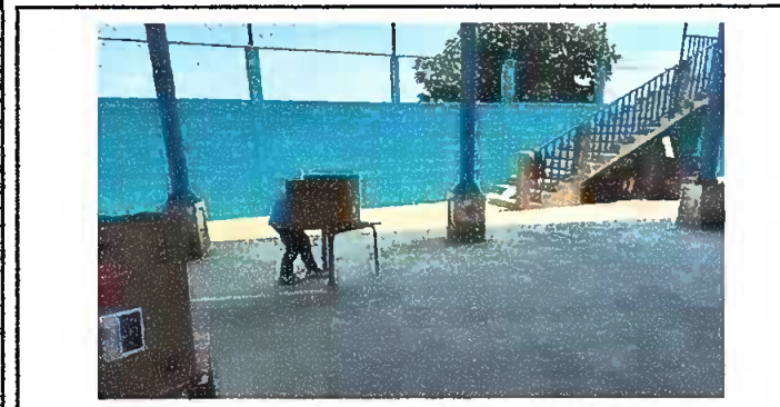
Modulo 5: Pinturas en muros exteriores

Observación: Si es necesario se pueden agregar hojas adicionales y actualizar el número de hojas.