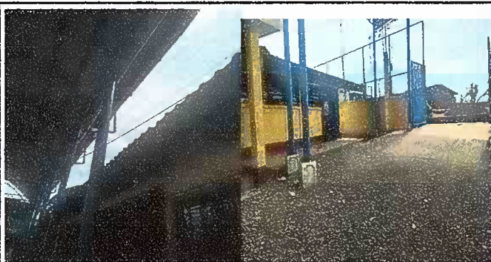
Modulo 3: Sustitución de canal de pvc, sustitucion de bajada de agua pluvial de metal por tubo pvc 3".