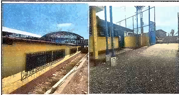
Modulo 4: Sustitucion de piso de torta de concreto, reparacion de cuneta de concreto, reparacion de banqueta.