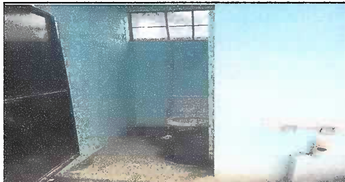
Modulo 1: Sustitucion de inodoros, lavamanos, tubería de línea principal, instalacion de tubería de agua potable y sustitucion de deposito de agua.