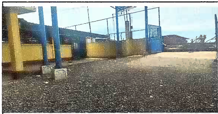
Modulo 5: Pinturas en muros exteriores