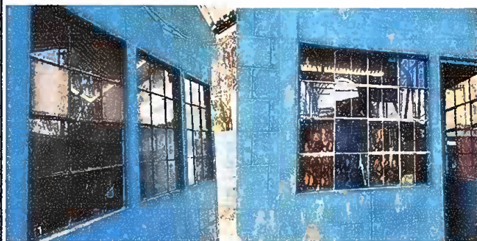
Modulo 2: Suministro e instalacion de balcones de hierro en ventanas y puerta de rejas.