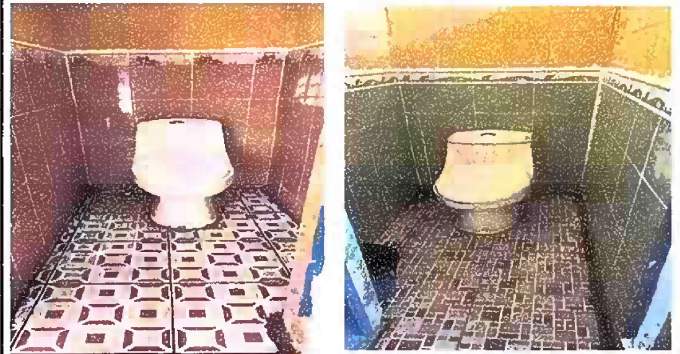
Foto 2: Módulo 1 sustitución de azulejo en baños de niños y niñas.