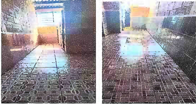
Foto1: Módulo 1 Sustitución de piso de torta de concreto por piso antideslizante en baños de niñas y niños.