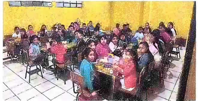
Foto 4: Módulo 2 Sustitución de piso de torta de concreto por piso cerámico en comedor escolar.