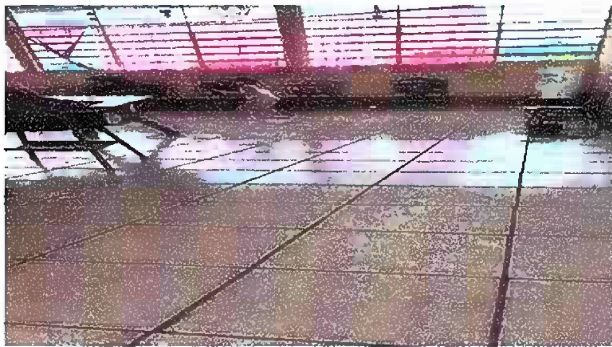
Foto 3: Módulo 2 Sustitución de piso de torta de concreto por piso cerámico en aula de primero y segundo primaria.