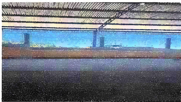
Foto 5: Reparación de muro perimetral de block con tubo hg y malla galvanizada, soleras intermedias y columnas.