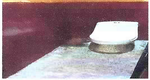
Foto 2: Módulo 1 sustitución de azulejo en baños de niñas y niños.