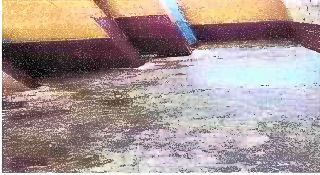
Foto 1: Módulo 1 Sustrucción de piso de torta de concreto por piso antideslizante en baños de niñas y niños.