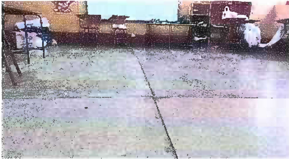
Foto 3: Módulo 2 Sustrucción de piso de torta de concreto por piso cerámico en aula de primero y segundo primaria.