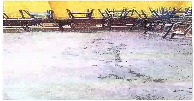
Foto 4: Módulo 2 Sustrucción de piso de torta de concreto por piso cerámico en comedor escolar.