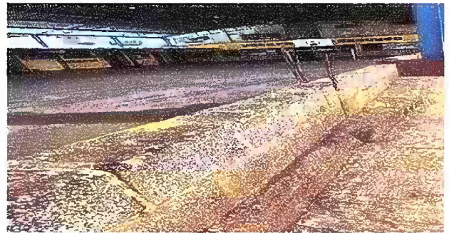
Foto 6: Reparación de muro perimetral de block con tubo hg y malla galvanizada, soleras intermedias y columnas.

Observación: Si es necesario se pueden agregar hojas adicionales y se debe indicar el número de hojas.