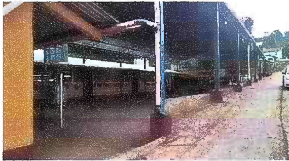
Foto 5: Reparación de muro perimetral de block con tubo hg y malla galvanizada, soleras intermedias y columnas.