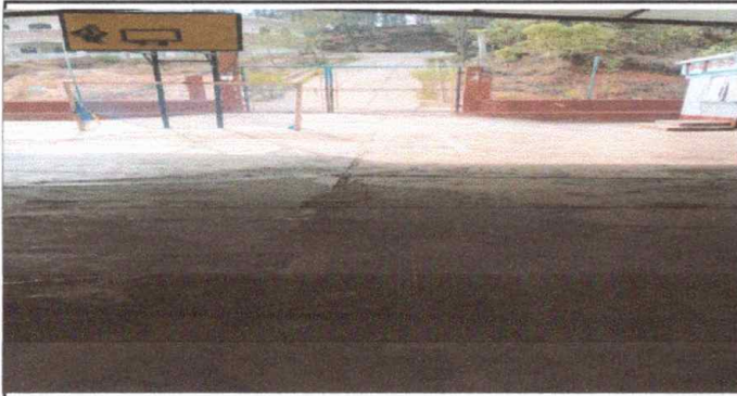
Foto 1: Entrada de la escuela, reparación de plancha de concreto de patio