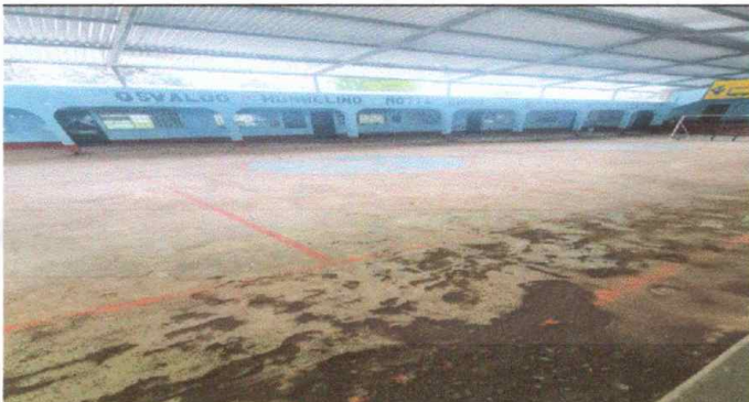
Foto 3: Enfrente de la oficina de la OPF, reparación de plancha de concreto de patio.