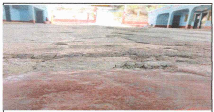
Foto 6: Enfrente del escenario, reparación de plancha de concreto de patio.

Observación: Si es necesario se pueden agregar hojas adicionales y actualizar el número de hojas.