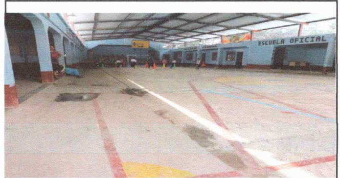
Foto 2: Enfrente de la dirección, reparación de plancha de concreto de patio.