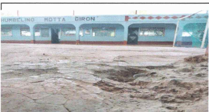
Foto 5: Enfrente de sala de computación, reparación de plancha de concreto de patio.