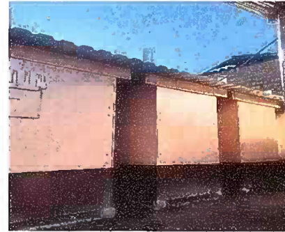
Foto 4: Módulo 4, sustitución de lámina por lámina troquelada aluzinc cal. 26.