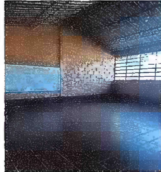
Foto 3: Módulo 3, sustitución de vidrios, balcones de metal y sustitución de piso de concreto por piso cerámico.