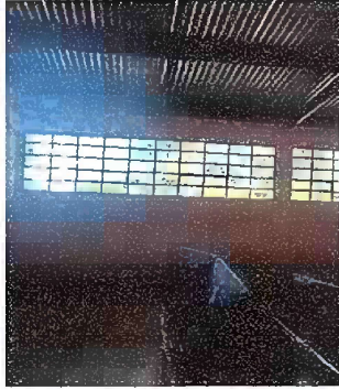
Foto1: Modulo 1: sustitución de vidrios