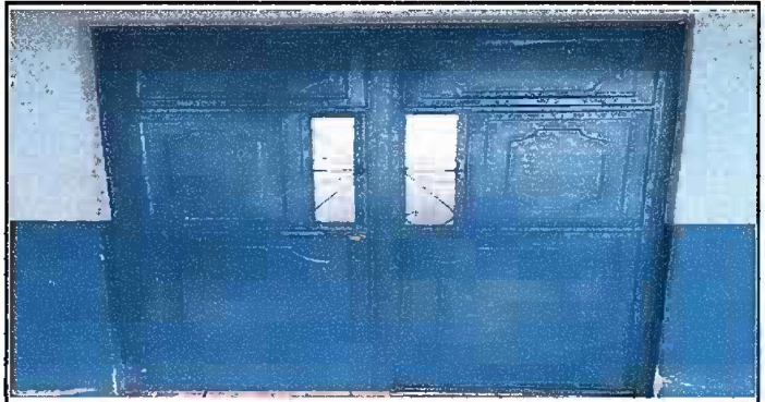
Foto 2: Módulo 1 (Planta baja y alta) - Mantenimiento a estructura de puerta (lijado, cambio de tubo, cepillado, sujeciones, aplicación de pintura).