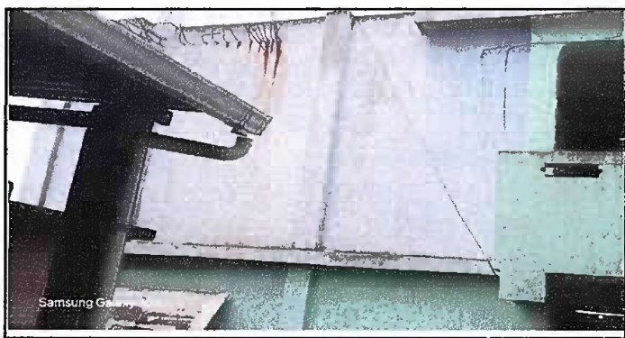
Foto 11: Módulo 3 (Muro perimetral) - Pintura en muros exterior e interior 2/3.