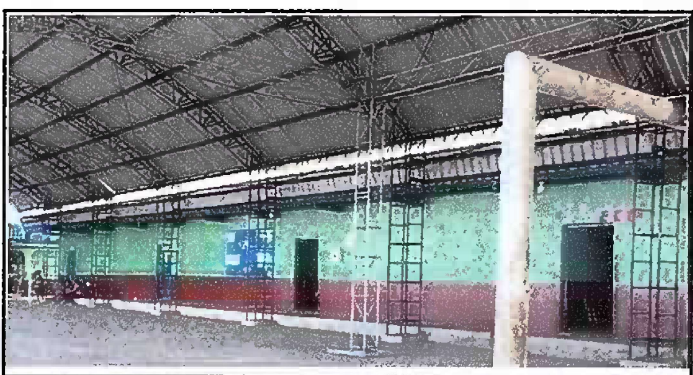
Foto 12: Módulo 3 (Muro perimetral) - Pintura en muros exterior e interior 3/3.

Observación: Si es necesario se pueden agregar hojas adicionales y actualizar el número de hojas.