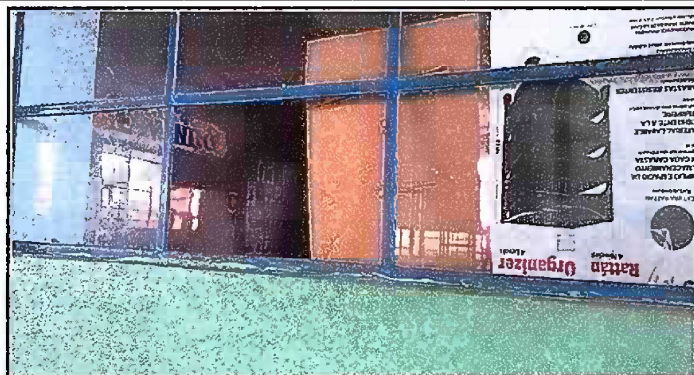
Foto 7: Módulo 2 (Planta alta y baja)- Sustitución de vidrios (ventanas).