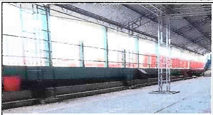
Foto 8: Módulo 3 (Muro perimetral) - Mantenimiento de baranda de metal.