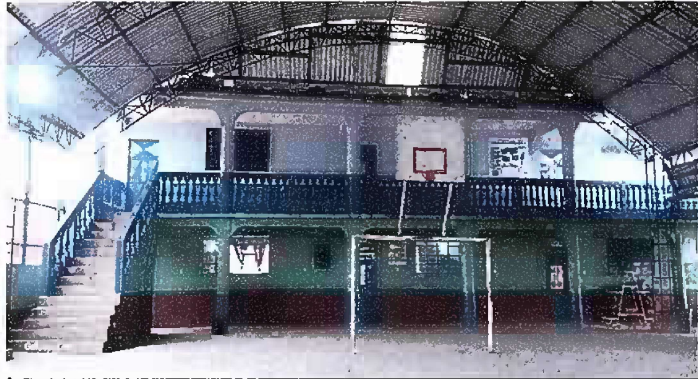
Foto 1: Módulo 1 (Planta baja y alta) - Mantenimiento de baranda de concreto.