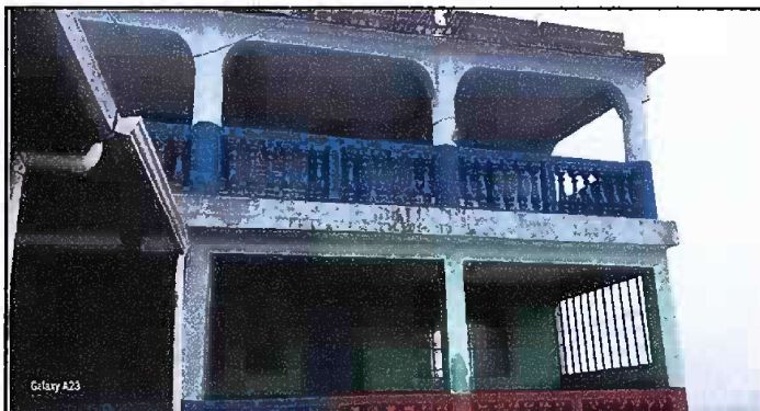
Foto 10: Módulo 3 (Muro perimetral) - Pintura en muros exterior e interior 1/3.