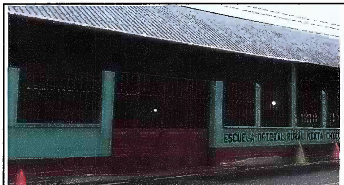
Foto 9: Módulo 3 (Muro perimetral) - Mantenimiento a portones de metal.