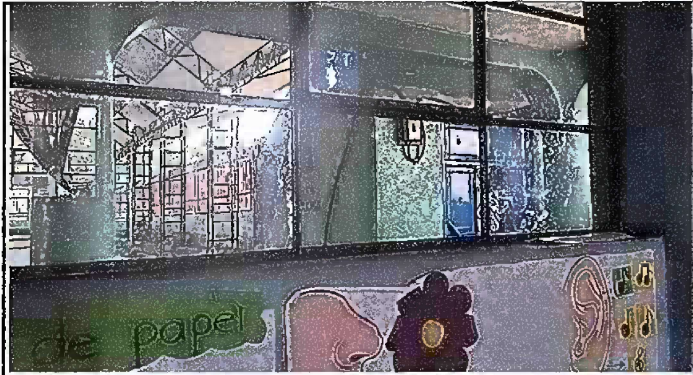
Foto 3: Módulo 1 (Planta baja y alta) - Mantenimiento a estructura de metal de ventana.