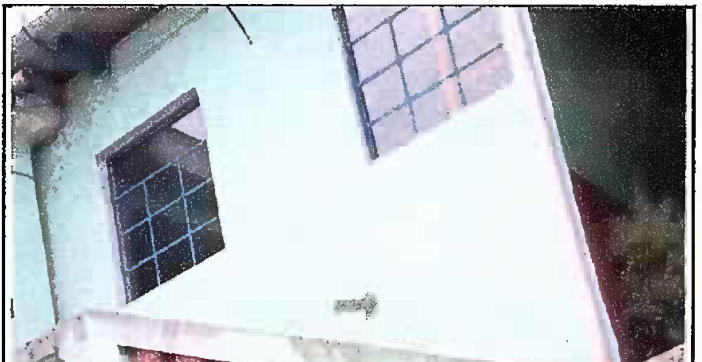
Foto 6: Módulo 2 (Planta alta y baja)- Mantenimiento a estructura de metal de ventana.

Observación: Si es necesario se pueden agregar hojas adicionales y finalizar el número de hojas.