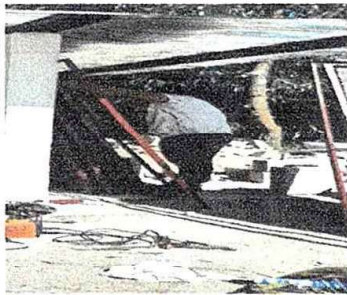
Foto 5: Modulo 2. suministro e instalacion de balcon de hierro en ventana