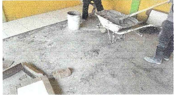
Foto 8: Modulo 2. sustitucion de piso de torta de concreto por piso cerámico.