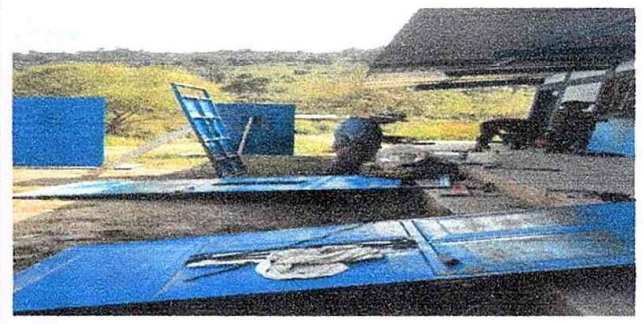
Foto 10:Modulo 2 Mantenimiento a estructura de puerta (lijado, cambio de tubo,sepillado ujeciones, aplicacion de pintura)