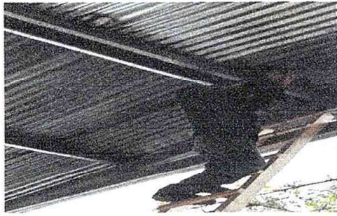
Foto7: Modulo 2. Sustitucion de focos ahorradores