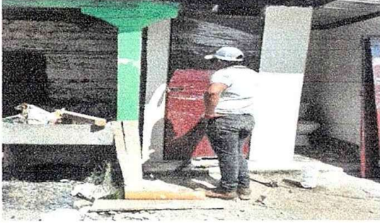
Foto1: Modulo 1. sustitucion puertas de metal en baños