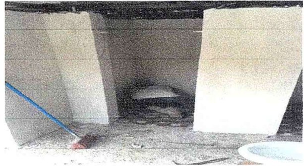
Foto 4:Modulo 1.Sustirucion de piso de torta de concreto por piso cerámicoantideslizante.