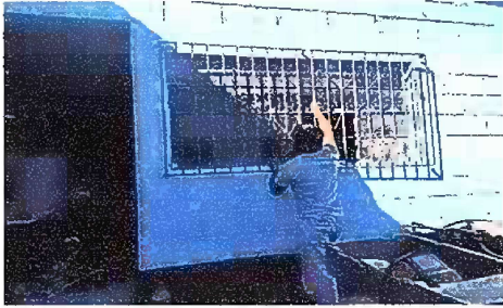
Foto1: Sustitucion e instalacion de balcon de hierro en ventan de cocina