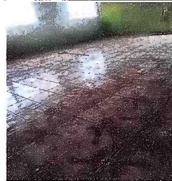
Foto 6: Reparación de piso de torta de concreto por piso ceramico

Observación: Si es necesario se pueden agregar hojas adicionales y actualizar el número de hojas.