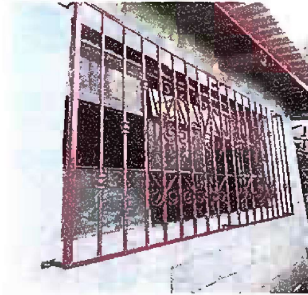
Foto 2: Sustitucion e instalacion de balcon de hierro en ventan de cocina