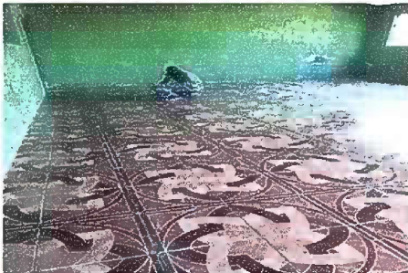
Foto 5: Reparación de piso de torta de concreto por piso ceramico