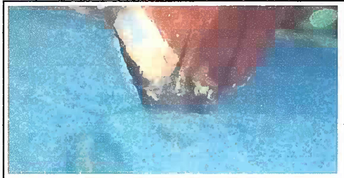
Modulo 3: Foto 5, Sustitucion de soporte de madera por metal.