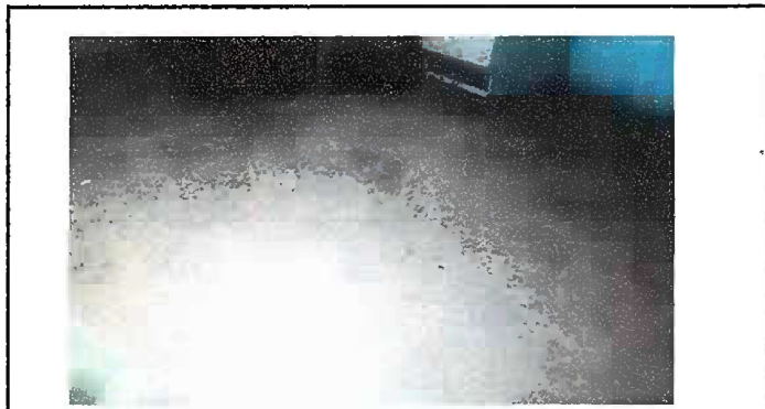
Módulo 2: foto 3, Sustitucion de piso de cemento por pisos ceramica.