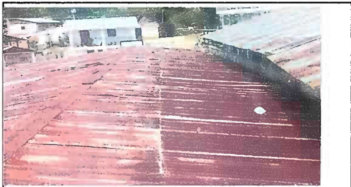
Módulo 3: Foto 4, Sustitucion de láminas por láminas troqueladas