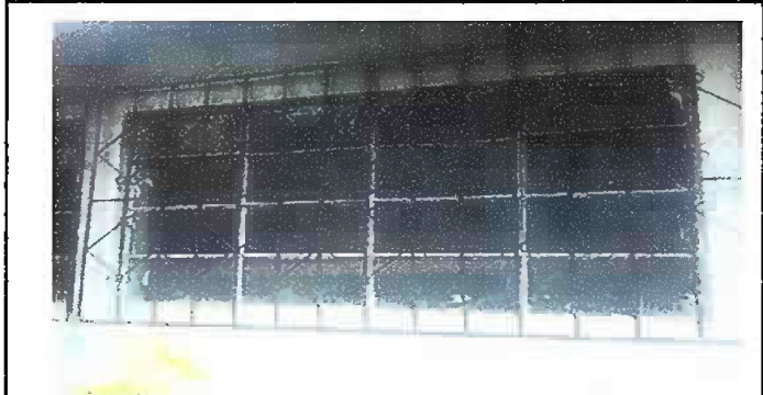
: Modulo 3: Foto 6, Sustitucion de vidrios nevadas por vidrios transparentes

Observación: Si es necesario se pueden agregar hojas adicionales y actualizarlas con el uso de hojas.