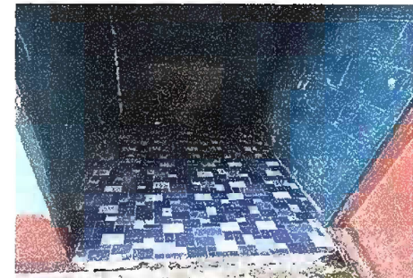
Foto 12: Módulo 3 Sustitución de piso de torta de concreto por piso cerámico antideslizante

Observación: Si es necesario se pueden agregar hojas adicionales y actualizar el número de hojas.