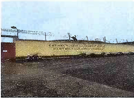
Foto 1: Muro Perimetral Reparación de tubo HG y malla galvanizada