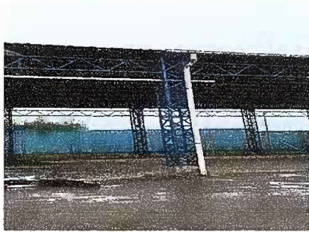
Foto 7 : Módulo 2 Reparación de bajada de agua pluvial tubo PVC 3"