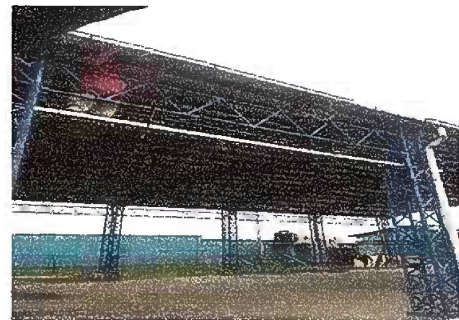
Foto 6: Módulo 2 Sustitución de soporte de metal para canal (pescantes)

Reparación de bajada de agua pluvial tubo PVC 3"