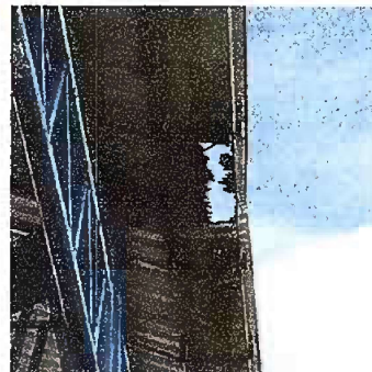
Foto 6: Módulo 2 Sustitución de soporte de metal para canal (pescantes)

Observación: Si es necesario se pueden agregar hojas adicionales y actualizar el número de hojas.