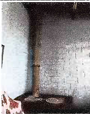
Foto 3: Módulo 1 Sustitución de plancha de metal de tres hornillas y suministro e intalación de azulejo en estufa rural