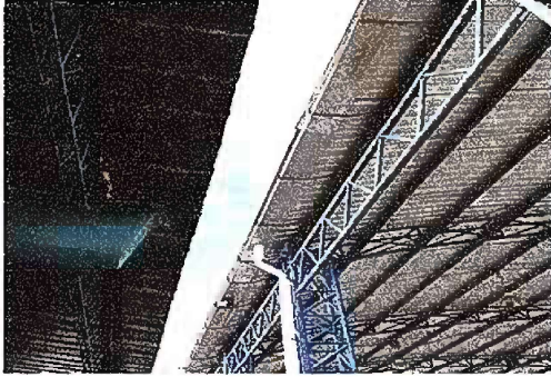
Foto 7 : Módulo 2 Reparación de bajada de agua pluvial tubo PVC 3"