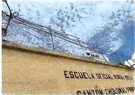
Foto 1: Muro Perimetral Reparación de tubo HG y malla galvanizada