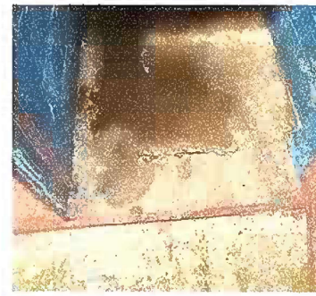
Foto 12: Módulo 3 Sustitución de piso de torta de concreto por piso cerámico antideslizante

Observación: Si es necesario se pueden agregar hojas adicionales y actualizar el número de hojas.