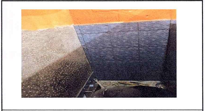
Modulo 2: Sustitución de inodoros, sustitución de azulejos