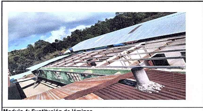
Modulo 4: Sustitución de láminas.