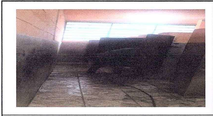
Modulo 2: Sustitución de puertas de servicios sanitarios