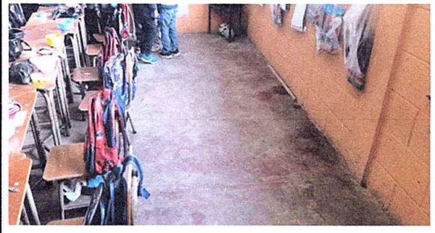
Modulo 3. sustitución de piso de concreto por piso cerámico.