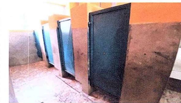
Modulo 2: Sustitución de puertas de servicios sanitarios