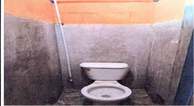
Modulo 2: Sustitución de inodoros, sustitución de azulejos