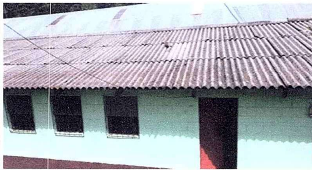
Foto1: Sustitución de láminas