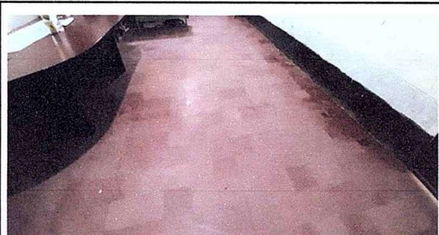
Modulo 1. Sustitución de piso por piso cerámico.

Observación: Si es necesario se pueden agregar hojas adicionales y actualizar el número de hojas.