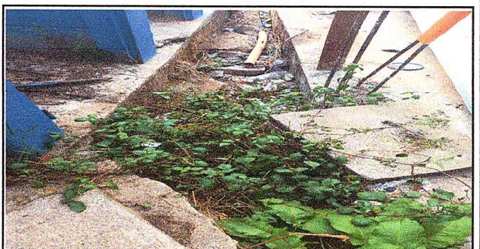
Foto 6: Modulo 5: Sustitución de tubería PVC línea principal aguas negras e Instalación de tubería PVC para aguas negras

Observación: Si es necesario se pueden agregar hojas adicionales y actualizar el número de hojas.