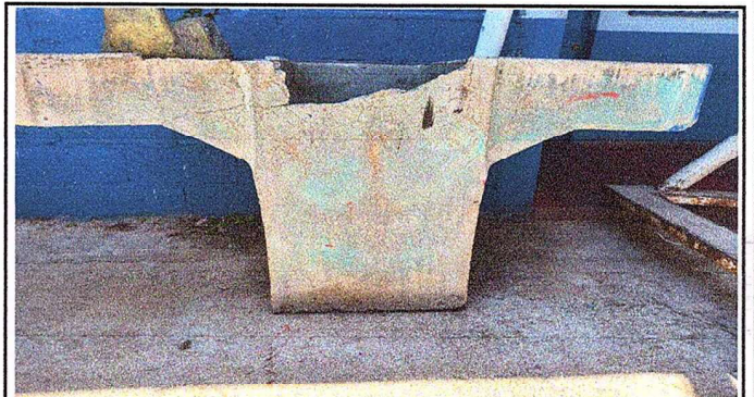
Foto 4: Modulo 5: Sustitución de pila de concreto de 2 lavaderos.