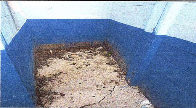
Foto 3: Modulo 5: Sustitución de inodoro e instalación de inodoro