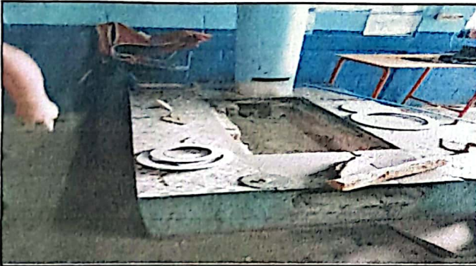
Foto 3: módulo 2, sustitución de plancha de metal de 3 hornillas.