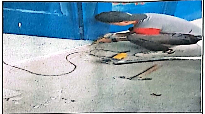
Foto2: módulo 2, sustitución de piso de torta de concreto por piso granito