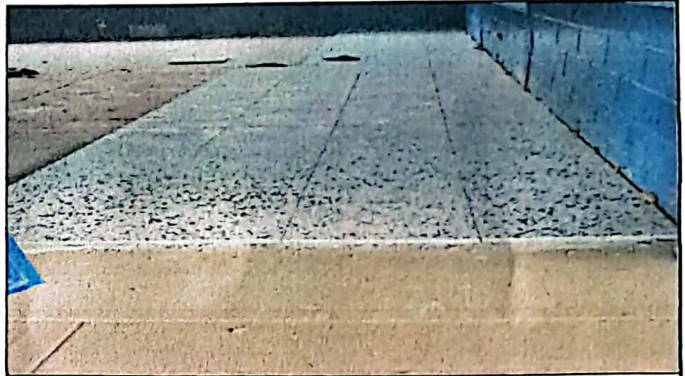
Foto 4: módulo 5, sustitución de piso de torta de concreto por piso granito