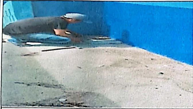
Foto1: módulo 1, sustitución de piso de torta de concreto por piso granito