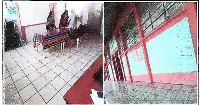
Foto 4: MODULO 2: Sustitución de torta de cemento por piso cerámico.