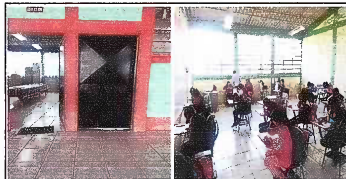
Foto 5: MODULO 2: Sustitución de puerta de metal y Sustitución de torta de cemento por piso cerámico.