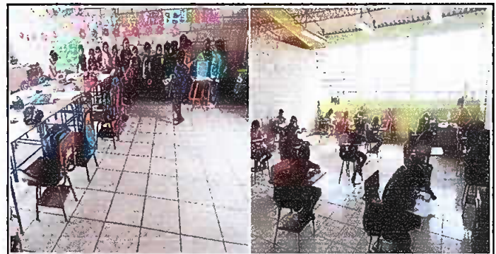
Foto 6: MODULO 3: Sustitución de torta de cemento por piso cerámico.

Observación: Si es necesario se pueden agregar hojas adicionales y actualizar el número de hojas.