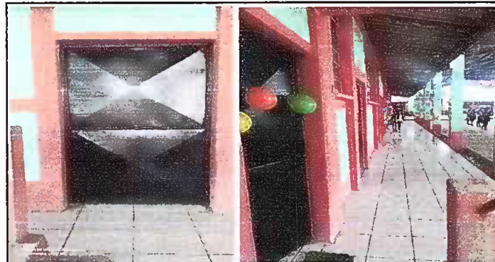
Foto 3: MODULO 2: Sustitución de torta de cemento por piso cerámico y Sustitución de puertas de metal.