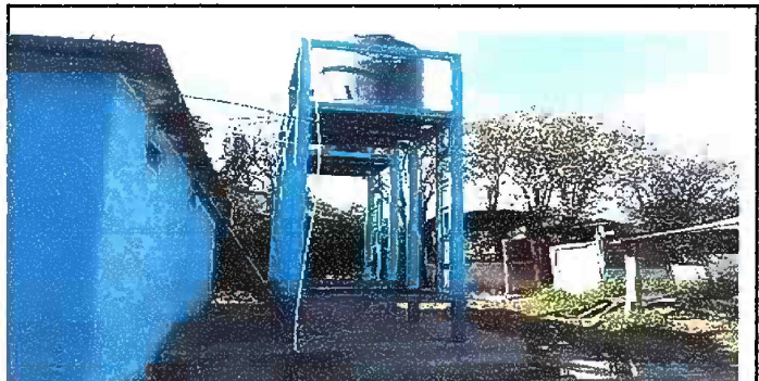
Foto 6: Módulo 5: Mantenimiento de base de metal de depósito de agua

Observación: Si es necesario se pueden agregar hojas adicionales y actualizar el número de hojas.