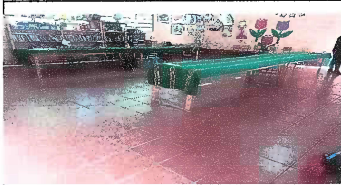
Foto1: Módulo 1 : Sustitución de piso concreto por piso ceramico