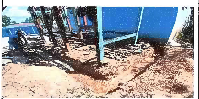
Foto 6: Módulo 5: Mantenimiento de base de metal de depósito de agua

Observación: Si es necesario se pueden agregar hojas adicionales y actualizar el número de hojas.