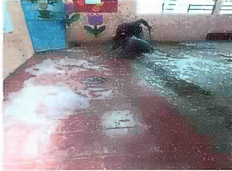
Foto1: Módulo 1 : Sustitución de piso concreto por piso ceramico