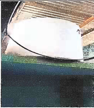
Foto 5: MODULO 1: SUMINISTRO E INSTALACION DE DEPOSITO DE AGUA 1100 LTS