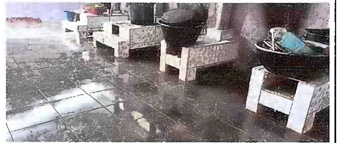
Foto 4: MODULO 1: SUSTITUCIÓN DE ESTUFA RURAL (COMPLETA) INCLUYE CHIMENEA Y PLANCHA DE METAL