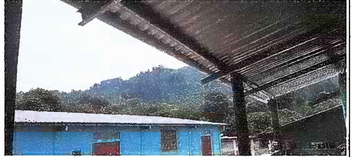
Foto 2: MODULO 1: SUSTITUCION DE ESTRUCTURA DE SOPORTE DE MADERA, POR METAL