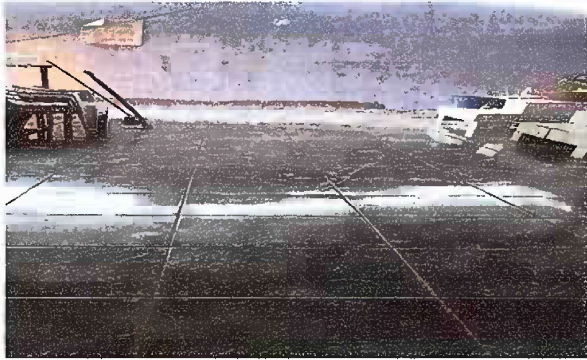
Foto 3: MODULO 1: SUSTITUCIÓN DE PISO DE CONCRETO, POR PISO CERAMICO