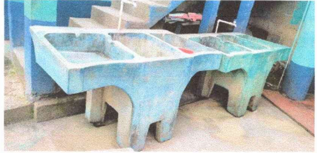
Foto 8. Módulo 2: sustitución de pila de cemento de dos lavaderos