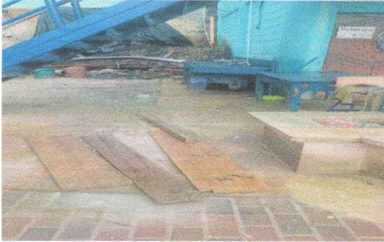
Foto 7. Módulo 2: sustitución tubería PVC línea principal aguas negras