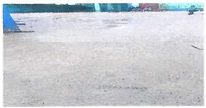
Patio: Reparación de planchas de concreto.