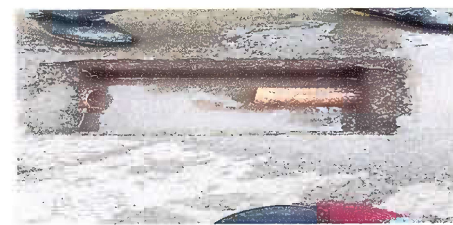
Patío: Sustitución de tubería PVC línea principal aguas negras