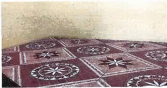
Modulo 1: Sustitución de piso cerámico.