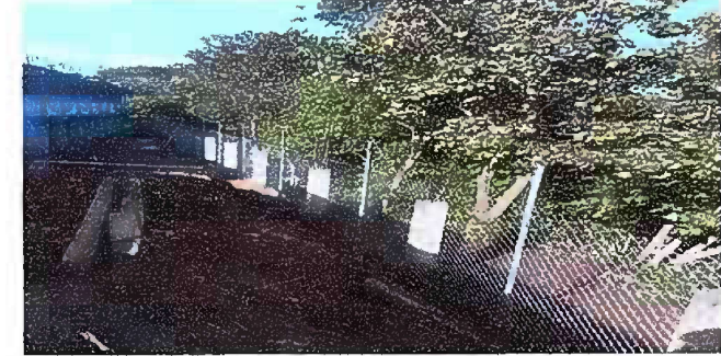
Modulo 4: Reparación de tubo HG y malla galvanizada

Observación: Si es necesario se pueden agregar hojas adicionales y actualizar el número de hojas.