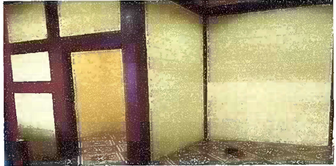
Modulo 1: Pintura en muros exteriores e interiores.