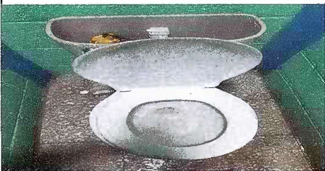
Modulo 2: Sustitucion inodoro