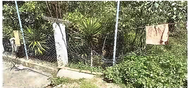
Modulo 4: Reparacion de muro perimetral de block con tuvo hg y malla galvanizada soleras intermedias y columnas

Observación: Si es necesario se pueden agregar hojas adicionales y actualizar el número de hojas.