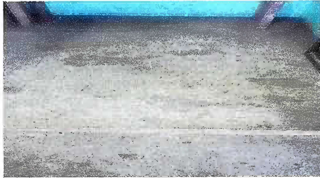
Modulo 1: Sustitucion de pliso ceramico