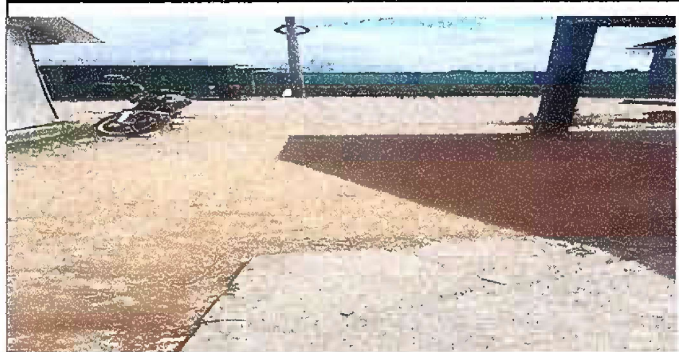
Modulo 3: Reparacion de piso de torta de concreto