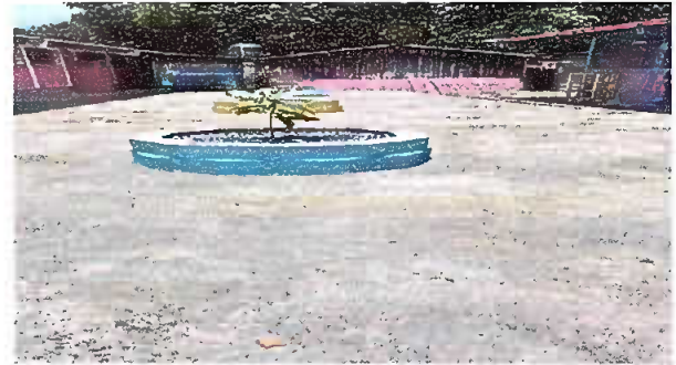
Foto 4: culminación de reparación de plancha de cocreto de patio.