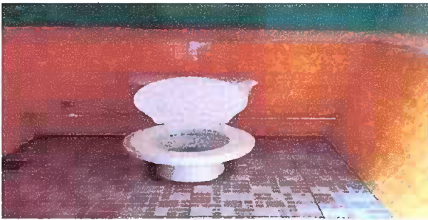
Foto 3: culminación de sustitución de piso de torta de concreto por piso ceramico y azulejos.