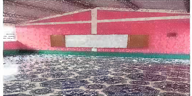
Foto 2: culminación de sustitución de piso de torta de concreto por piso ceramico.