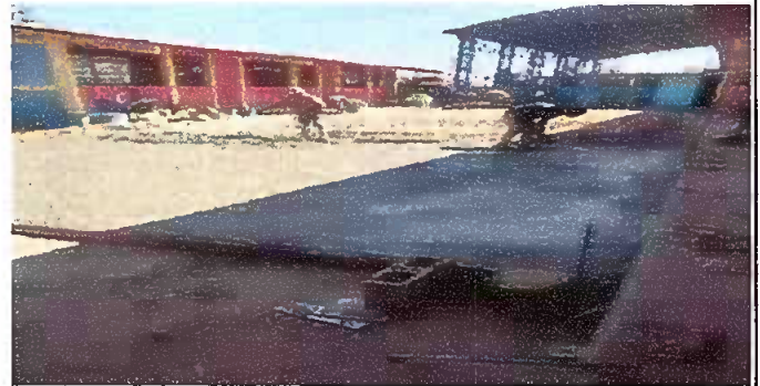
Foto 4: el avance de reparación de plancha de concreto del patio.