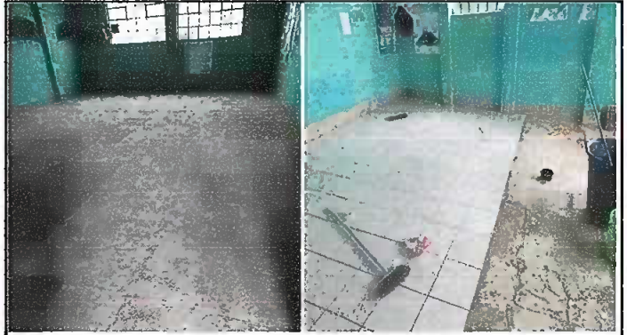
Fotografía 4. MODULO 2: Reparación de piso cerámico