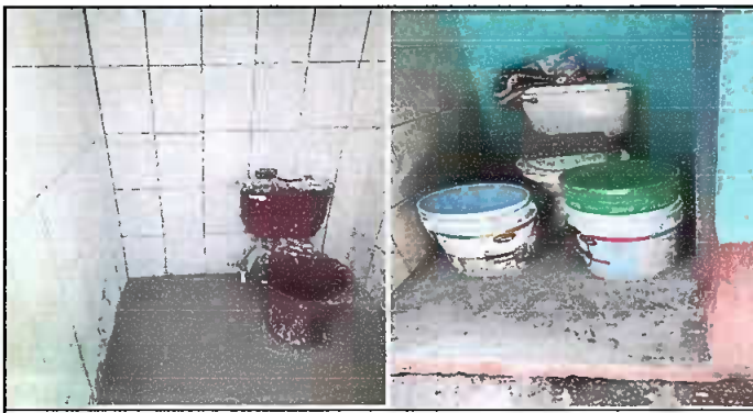
Fotografía 5. MODULO 3: Sustitución de piso de torta de concreto, por piso cerámico antideslizante