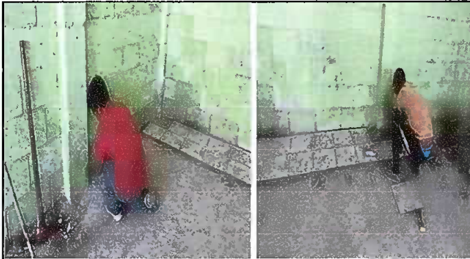
Fotografía 3. MODULO 2: Sustitución de piso de torta de concreto, por piso cerámico