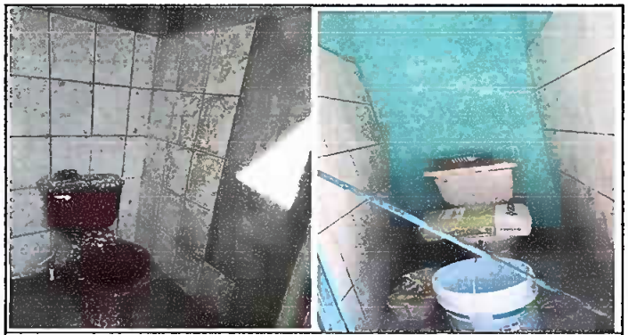
Fotografía 6. MODULO 3: Suministro de azulejos

Observación: Si es necesario se pueden agregar hojas adicionales y actualizar el número de hojas.