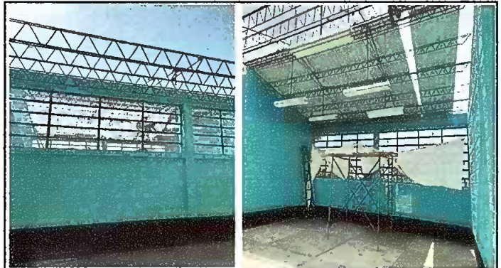
Fotografía 2. MODULO 1: Sustitucion de estructura de soporte de metal, por metal