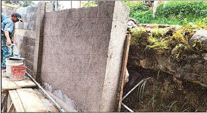
Foto1: REPELLO DEL MURO DE CONTENCIÓN