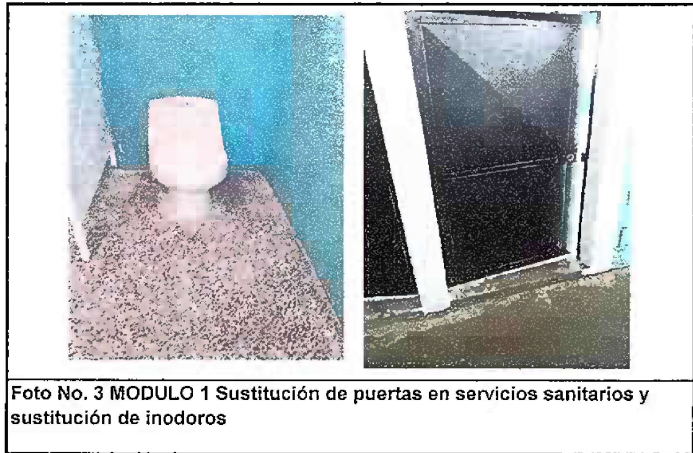
Foto No. 3 MODULO 1 Sustitución de puertas en servicios sanitarios y sustitución de inodoros