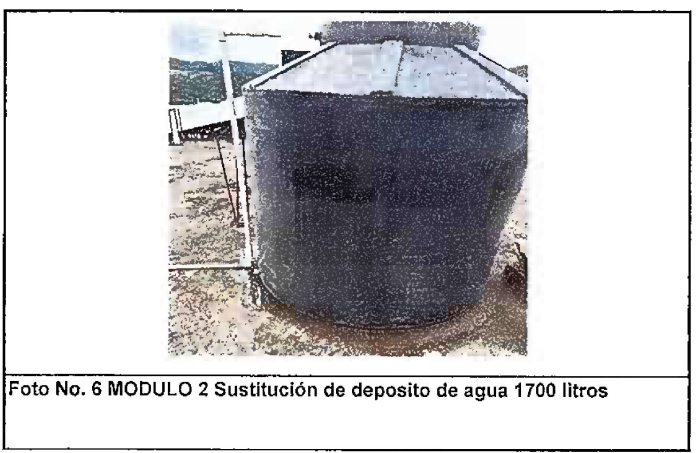
Foto No. 6 MODULO 2 Sustitución de deposito de agua 1700 litros

Observación: Si es necesario se pueden agregar hojas adicionales y aplicar el número de hojas.