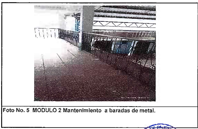
Foto No. 5 MODULO 2 Mantenimiento a baradas de metal.