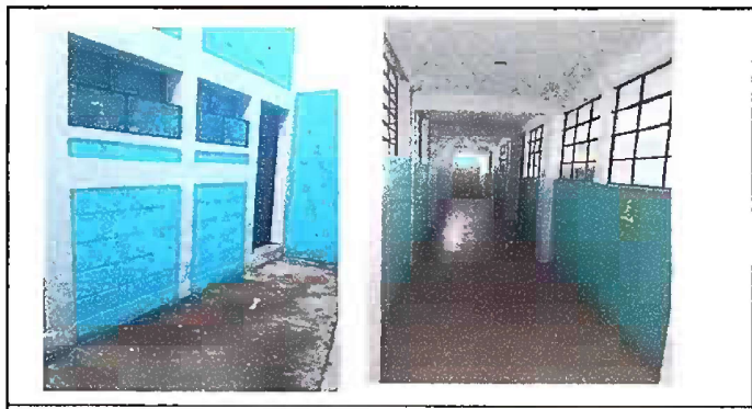
Foto No. 12 MODULO 6 Pintura general en muros exteriores e interiores de la escuela.

Observación: Si es necesario se pueden agregar hojas adicionales y actualizar el número de hojas.