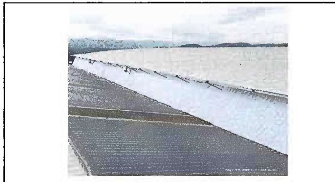
Foto No. 9 MODULO 5 Sustitución de canal de metal y sustitución de soporte de metal para canal.