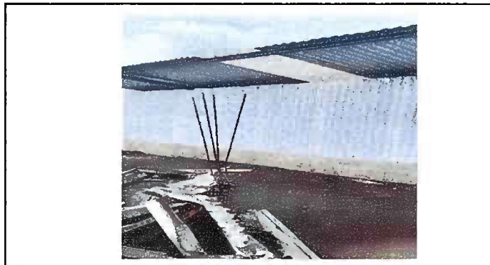
Foto No. 10 MODULO 5 Sustitución de láminas por láminas traslucida policarbonato