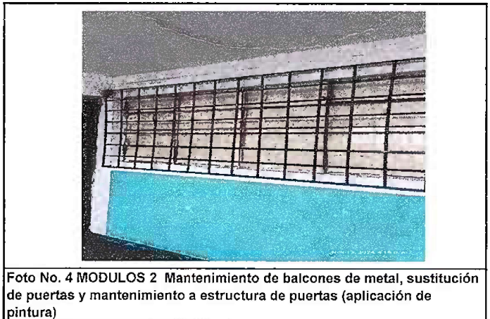
Foto No. 4 MODULOS 2 Mantenimiento de balcones de metal, sustitución de puertas y mantenimiento a estructura de puertas (aplicación de pintura)