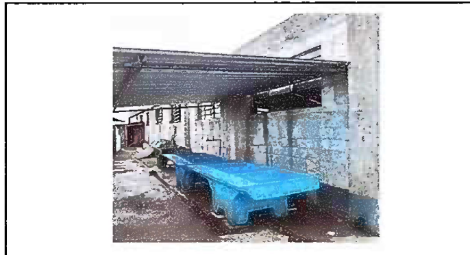
Foto No. 7 MODULO 3 Sustitución de pila por pilas de cemento de dos lavaderos.