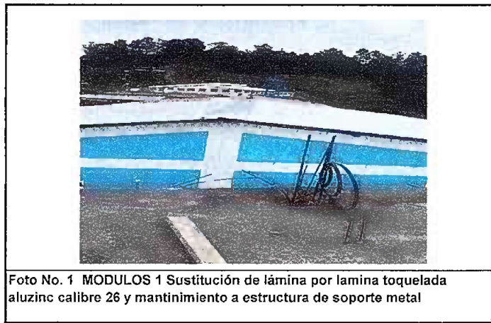
Foto No. 1 MODULOS 1 Sustitución de lámina por lamina toquelada aluzinc calibre 26 y mantenimiento a estructura de soporte metal