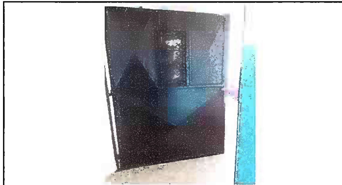
Foto No. 8 MODULO 4 Mantenimiento a estructura de puerta (aplicación de pintura)