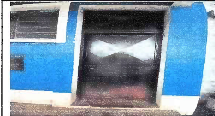
Foto 4: Módulo III. Sustitución de puerta en servicios sanitarios