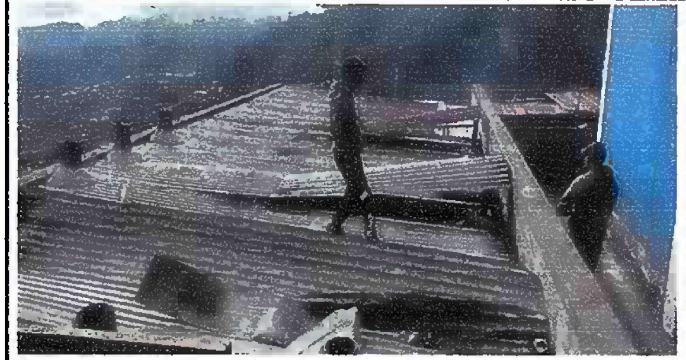
Foto 2: Modulo II. Sustición de láminas por láminas traquelada aluzinc calibre 26