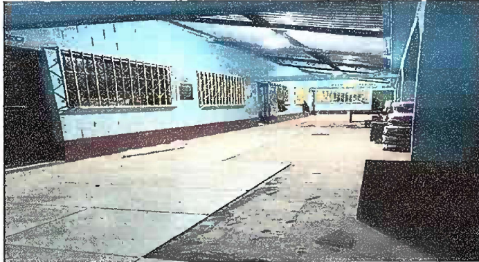
Foto 1: MODULO 1: corredor de las 6 aulas lado izquierdo, sustitucion de piso de granito