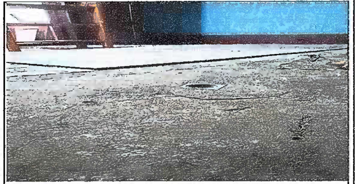
Foto 6: MODULO 3: adentro de la cocina, sustitucion de piso de granito.

Observación: Si es necesario se pueden agregar hojas adicionales y actualizar el número de hojas.