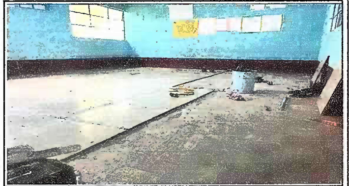
Foto 4: MODULO 1: adentro del aula de 4to. A, sustitucion de piso de granito.