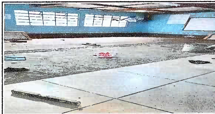
Foto 5: MODULO 2: adentro del aula 5to. B. sustitucion de piso de granito.