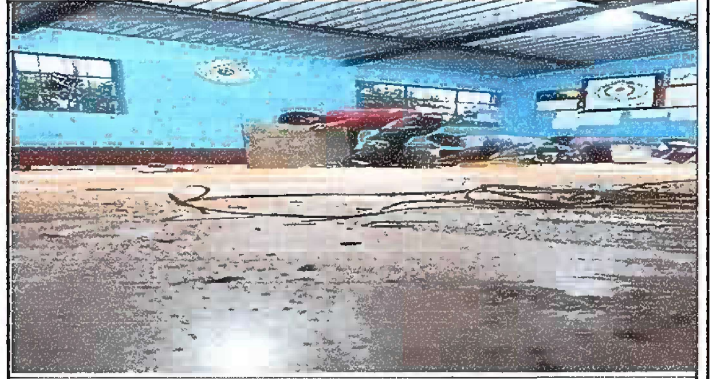
Foto 2: MODULO 1: adentro de la direccion, sustitucion de piso de granito.