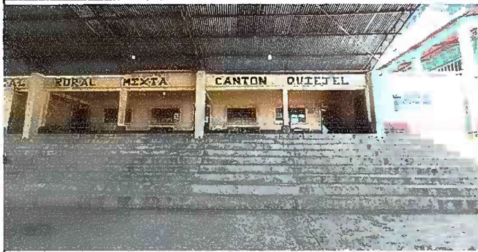
Foto1: sustitucion de pintura de interiores y exteriores modulo 1