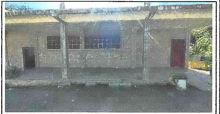
sustitucion de piso de torta de concreto por piso ceramico modulo 2

Observación: Si es necesario se pueden agregar hojas adicionales y actualizar el número de hojas.