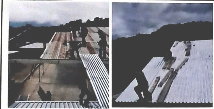
Foto1: Módulo 1. Desmontaje e Instalación de lámina troquelada aluzinc calibre 26