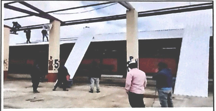
Foto 2: Módulo 1. Instalación de lámina troquelada aluzinc calibre 26