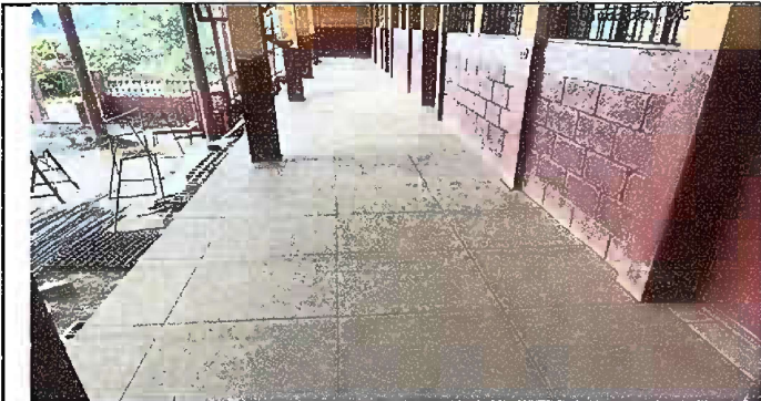
Foto 3: Módulo 2: Sustitución de piso de concreto por piso de cerámico