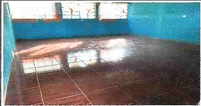
Foto 5: Modulo 3: Sustitución de piso de concreto por piso de cerámico