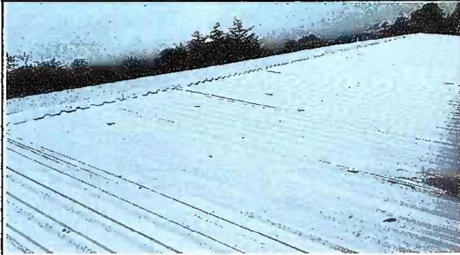
Foto1: Módulo 1: Sustitución de tornillo, capote y láminas troquelada aluzinc calibre 26