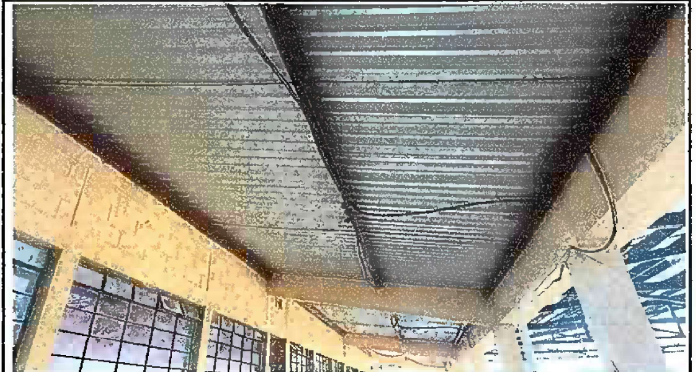
Foto2: Módulo 1: Mantenimiento a estructura de metal