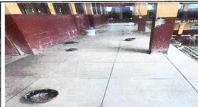
Foto 3: Módulo 2: Avance de Sustitución de piso de concreto por piso de cerámica