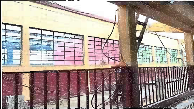
Foto 1: Módulo 1: Avance de Sustitución de tornillo, capote y laminas troquelada aluzinc calibre 26