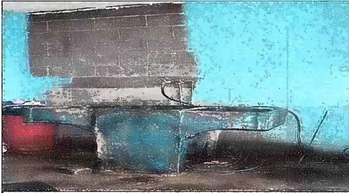
Foto 7: SUSTITUCION DE PILA DE CEMENTO DE 2 LAVADEROS, EN MODULO 7