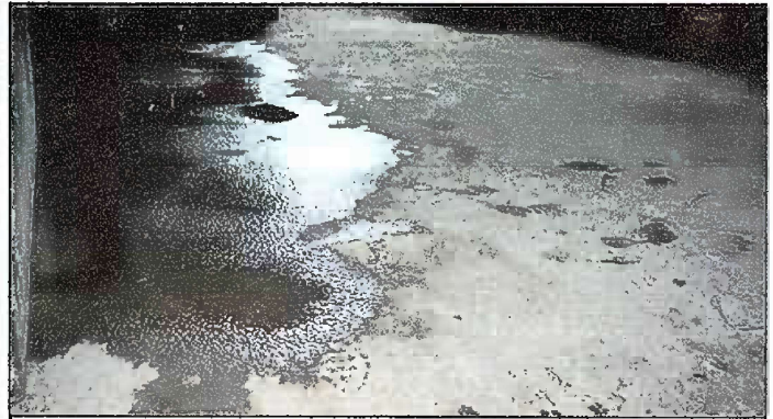
Foto 8: SUSTITUCION DE PISO DE TORTA DE CONCRETO EN COCINA Y EN BODEGA, EN MODULO 7