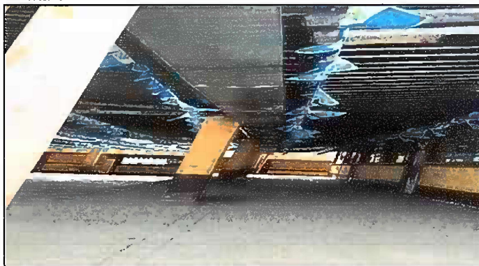
Foto 2: SUSTITUCION DE BAJADA DE AGUA PLUVIAL DE METAL A PVC MODULO 1