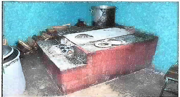
Foto 10: REPOSICION DE 2 PLANCHAS DE METAL DE 3 HORNILLAS EN LA COCINA, EN MODULOS 7.

Observación: Si es necesario se pueden agregar hojas adicionales y actualizar el número de hojas.