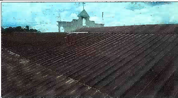
Foto 1: SUSTITUCION DE LAMINA POR LAMINA TROQUELADA EN MODULOS 1.