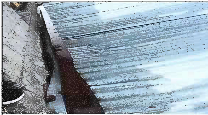
Foto 4: SUSTITUCION DE LAMINA POR LAMINA TROQUELADA EN MODULOS 2.