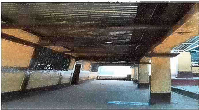
Foto 3: SUSTITUCION DE ESTRUCTURA DE SOPORTE DE MADERA POR METAL EN MODULO 2