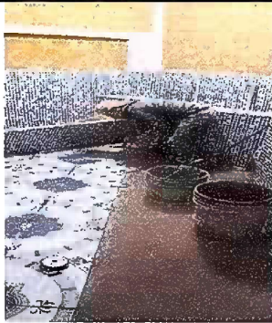
Foto 3, Módulo 1: Sustitución de piso de concreto por piso ceramico.