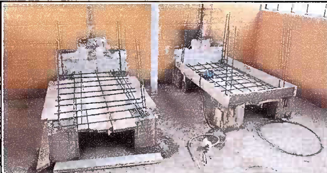
Foto 5, Módulo 2: Sustitución de estufa rural y sustitución de azulejos