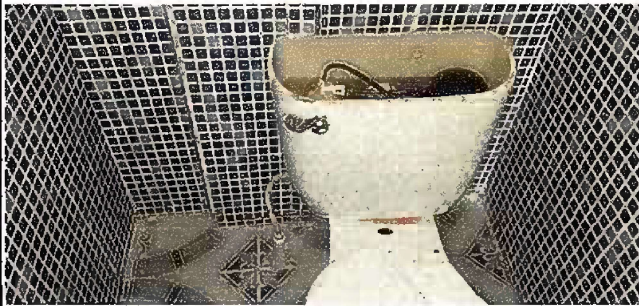
Foto 1, Módulo 1: sustitución de accesorios inodoro (contra llave, tubo de abasto y tanque)