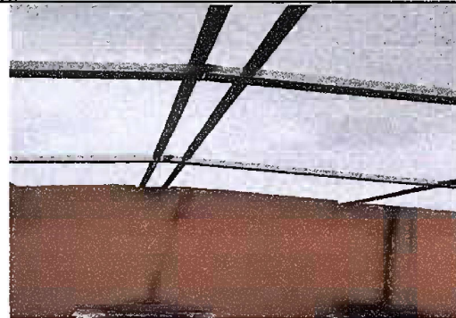
Foto 4, Módulo 2: Sustitución de lámina, por lámina troquelada aluzinc calibre 26 y Sustitución de estructura de soporte de madera, por metal.