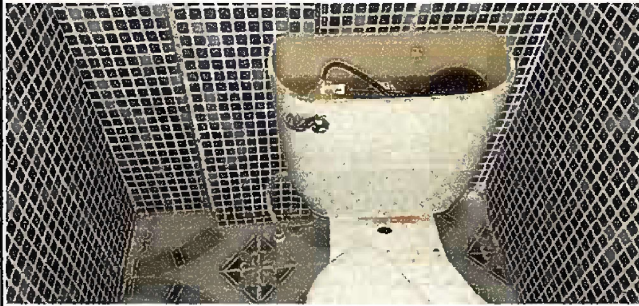
Foto 1, Módulo 1: sustitución de accesorios inodoro (contra llave, tubo de abasto y tanque)