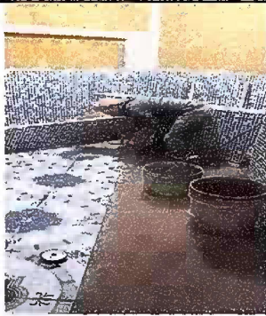
Foto 3, Módulo 1: Sustitución de piso de concreto por piso ceramico.