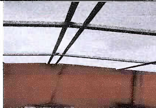
Foto 4, Módulo 2: Sustitución de lámina, por lámina troquelada aluzinc calibre 26 y Sustitución de estructura de soporte de madera, por metal.