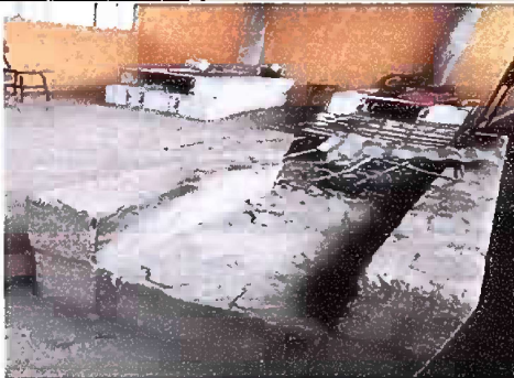
Foto 5, Módulo 2: Sustitución de estufa rural y sustitución de azulejos