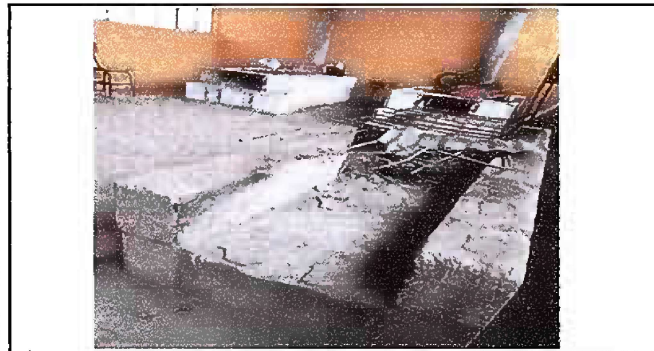
Foto 5, Módulo 2: Sustitución de estufa rural y sustitución de azulejos