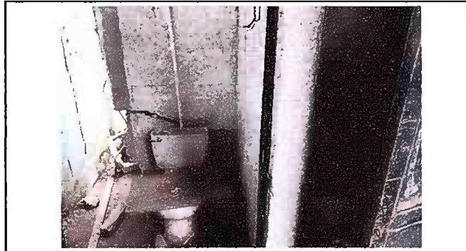
Foto 1, Módulo 1: sustitución de accesorios inodoro (contra llave, tubo de abasto y tanque)