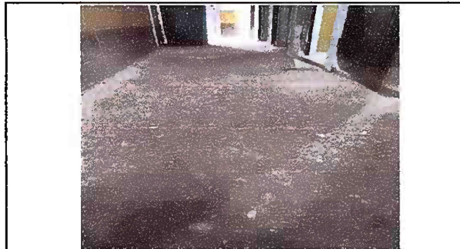
Foto 3, Módulo 1: Sustitución de piso de concreto por piso ceramico.