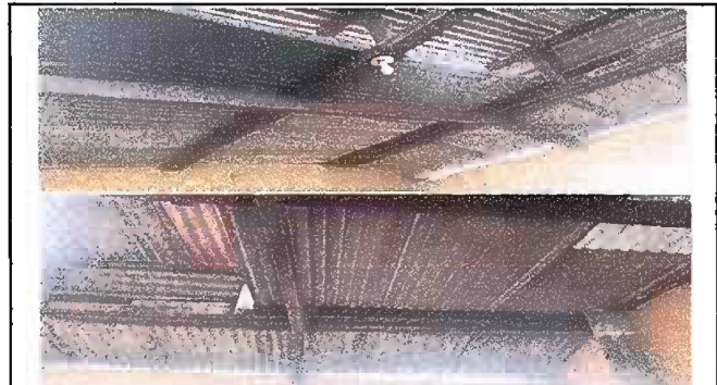
Foto 4, Módulo 2: Sustitución de lámina, por lámina troquelada aluzinc calibre 26 y Sustitución de estructura de soporte de madera, por metal.