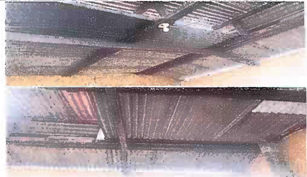
Foto 4, Módulo 2: Sustitución de lámina, por lámina troquelada aluzinc calibre 26 y Sustitución de estructura de soporte de madera, por metal.