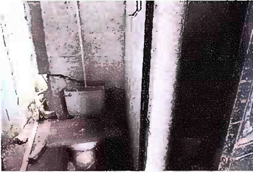
Foto 1, Módulo 1: sustitución de accesorios inodoro (contra llave, tubo de abasto y tanque)