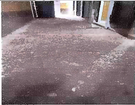
Foto 3, Módulo 1: Sustitución de piso de concreto por piso ceramico.