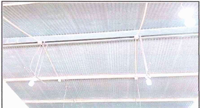
FOTO 4 Módulo 1: Mantenimiento de estructura de soporte de metal en aulas 4, 5 y 6