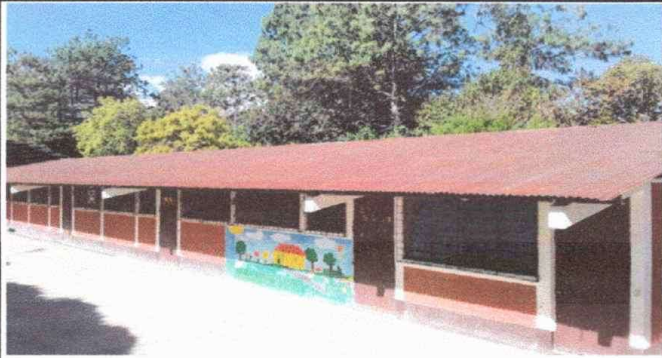
FOTO 1 Módulo 1: Sustitución de láminas por láminas troqueladas aluzinc calibre 26.