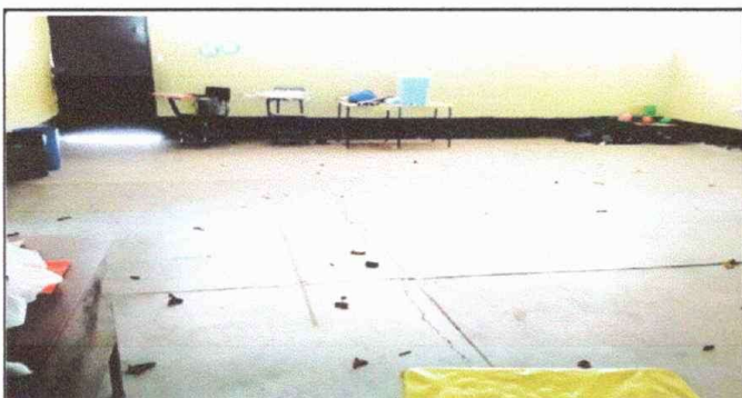
FOTO 5 Módulo 1: Cambio de piso de concreto en aulas 4, 5 y 6, por piso cerámico.