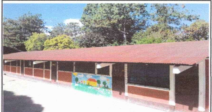
FOTO 2 Módulo 1: Sustitución de capote de lámina por capote de lámina troquelada.