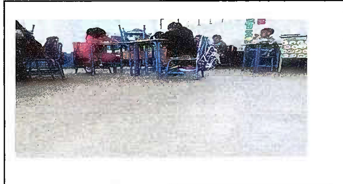
Foto 1: MODULO 1 Sustitucion de piso de torta de concreto por piso ceramico