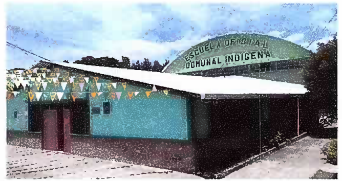
Foto 2: Modulo 1. Sustitución de lámina, por lámina troquelada aluzinc calibre 26, desinstalación de lámina existente