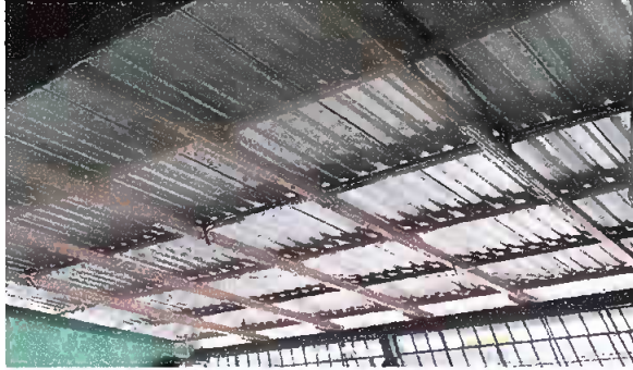
Foto 1: Modulo 1. Desinstalación e instalación del sistema eléctrico existente