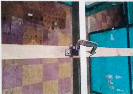
Foto 3: Modulo 1: Sustitución de elementos de fijación (tornillos) Instalación de lamina aluzinc