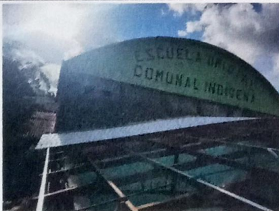
Foto 5: Modulo 1: Sustitución de canal de metal, sustitución de agua pluvial, tubo PVC 3"