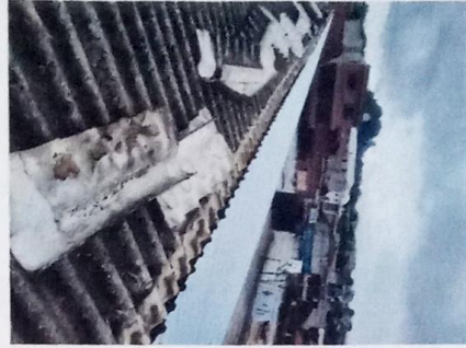
Foto 2: Modulo 1: Sustitución de lámina, por lámina troquelada aluzinc calibre 26, desinstalacion de lamina existente