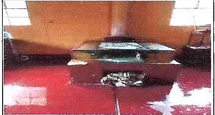
Foto 2: MODULO 2 SUSTITUCIÓN DE ESTUFA RURAL (COMPLETA) INCLUYE CHIMENEA Y PLANCHA DE METAL