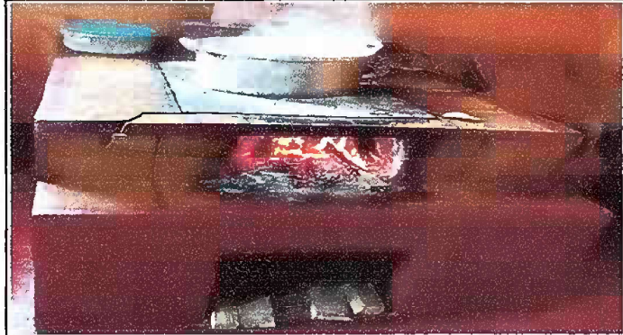
Foto 1: MODULO 2 SUSTITUCIÓN DE ESTUFA RURAL (COMPLETA) INCLUYE CHIMENEA Y PLANCHA DE METAL