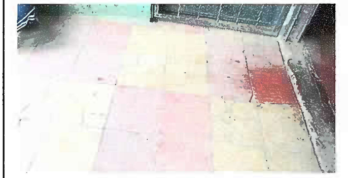
Foto 1: (MODULO 1). Estado actual de los pisos de los salones de clase en malas condiciones, se necesita sustitución de piso.