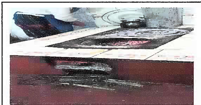
Foto 5: (MODULO 2). vista de la plancha, actualmente se encuentra en malas condiciones, se necesita sustitución de plancha.