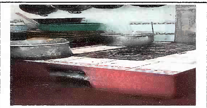
Foto 6: (MODULO 2). se observa las malas condiciones de la plancha, por el tiempo de vida de los materiales, se necesita sustitución de estufa rural.

Observación: Si es necesario se pueden agregar hojas adicionales y actualizar el número de hojas.