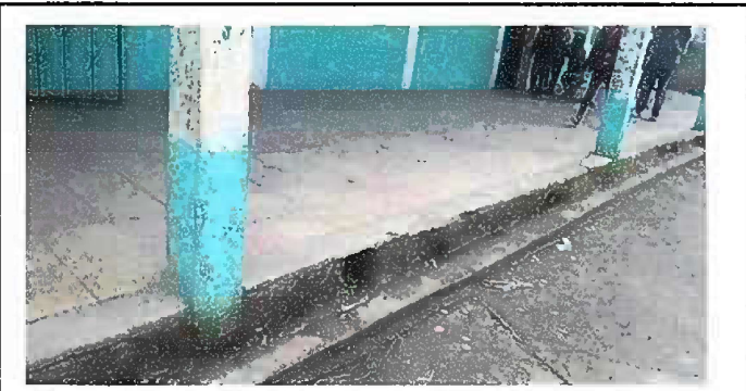
Foto 4: (MODULO 1). Actualmente el establecimiento necesita sustitución.