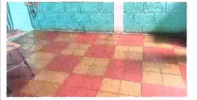
Foto 2: (MODULO 1). Los pisos en malas condiciones necesita sustitución.