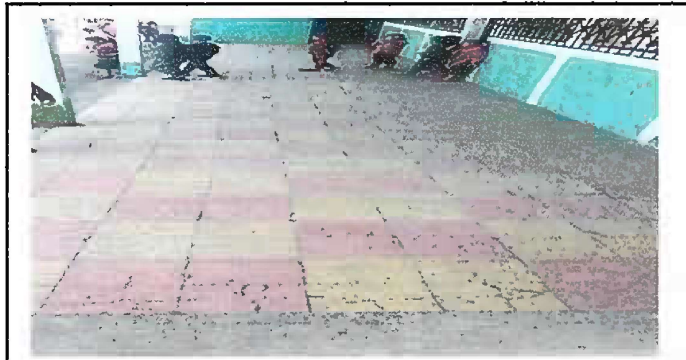
Foto 3: (MODULO 1). El corredor de los salones de clase, actualmente se encuentra en malas condiciones, necesita sustitución.