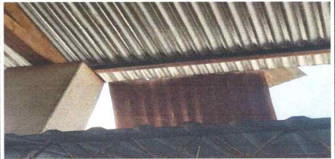
Foto 2: Sustitución de lámina por láminas troqueladas aluzinc calibre 26