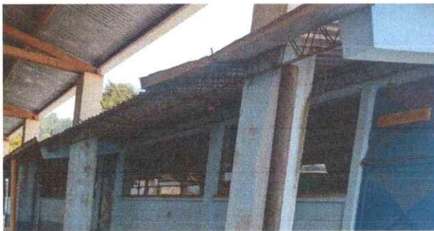
Foto 3: En el techado de patio y de aulas. Sustitución de canal de metal por tubería de pvc de aguas pluviales