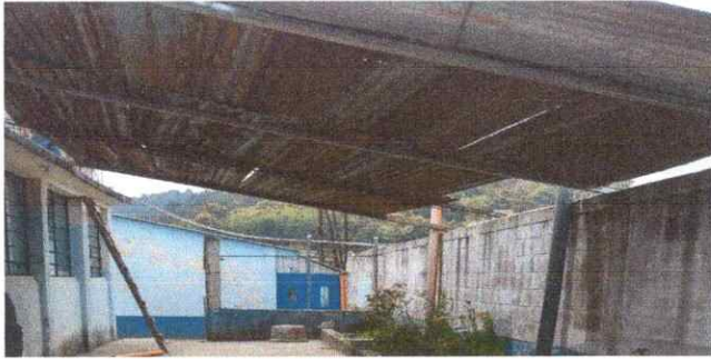
Foto1: Techado de Sanitario y alrededor. Sustitución de lámina por lámina troqueladas aluzinc calibre 26