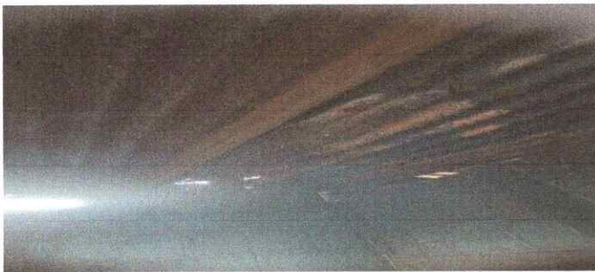
Foto 5: Sustitución de láminas por láminas troqueladas aluzinc calibre 26