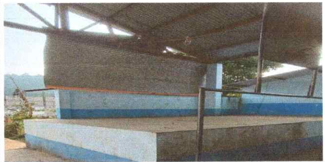
Foto 6: Sustitución de lámina por lámina troquelada aluzinc calibre 26

Observación: Si es necesario se pueden agregar hojas adicionales y actualizar el número de hojas.