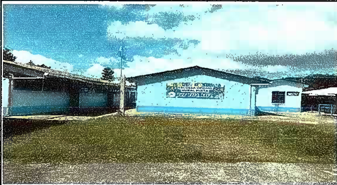
Foto1: PINTURA GENERAL: PINTURAS EN MUROS INTERIOR Y EXTERIOR