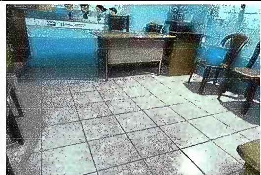
Foto 6: MODULO 4, SUSTITUCIÓN DE PISO DE TORTA DE CONCRETO POR PISO CERAMICO

Observación: Si es necesario se pueden agregar hojas adicionales y actualizar el número de hojas.