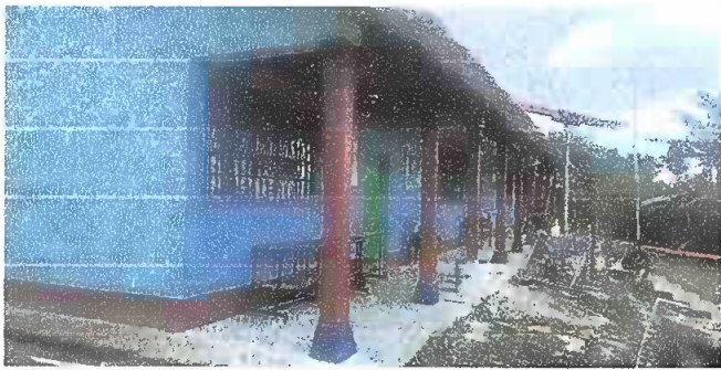
SUSTICION DE PISO