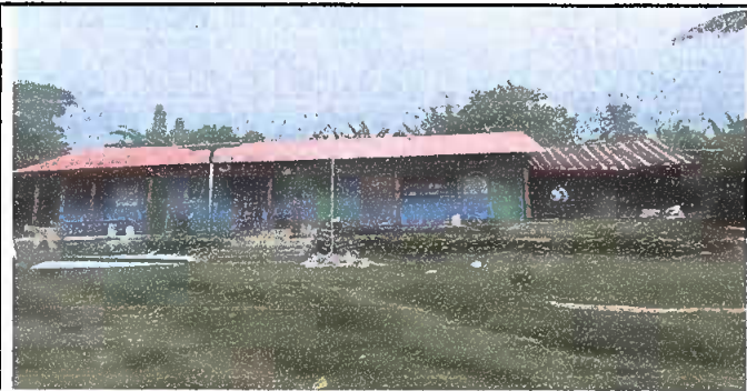
TRABAJO DE ESCUELA TERMINADO