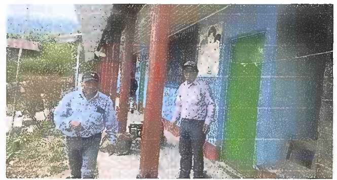
SUSTITUCION DE PUERTAS