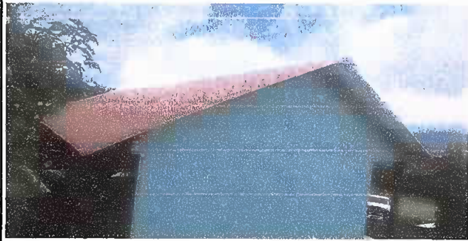
SUSTITUCION DE LAMINA Y PINTURAQ