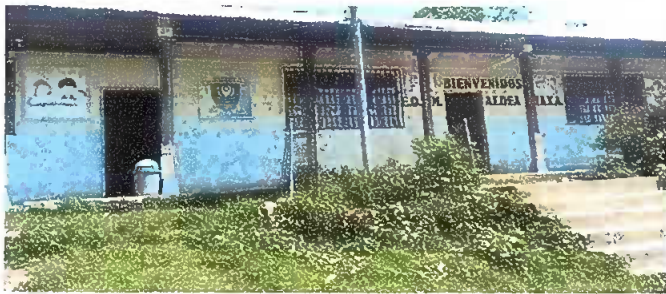
Foto1: SUSTITUCION DE PINTURA GENERAL