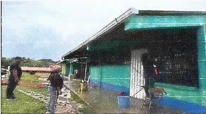
Foto1: MODULO 1