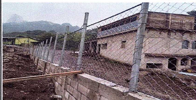
FOTO 1 SUSTITUCION DE MAYA PARA LA CIRCULACION