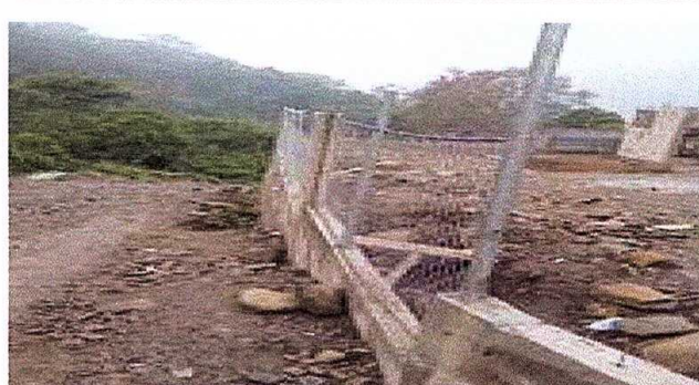
FOTO 2 SUSTITUCION DE ALAMBRE Y TUBO GALVANIZA DE LA CIRCULACION