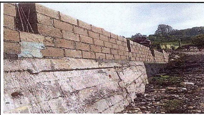
FOTO 4 SUSTITUCION DE MURO PARA LA CIRCULACION