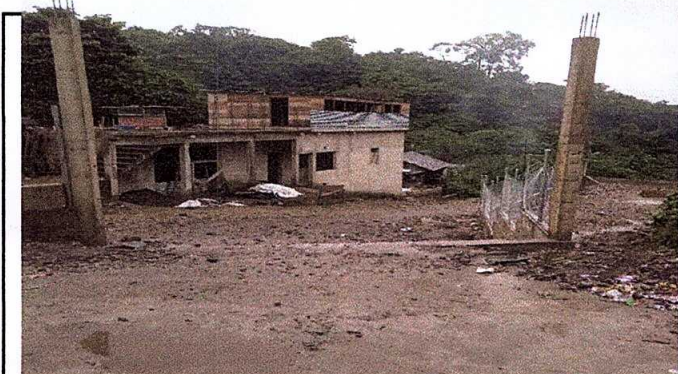
foto 3 SUSTITUCION DE CULUMNAS DEL PORTON